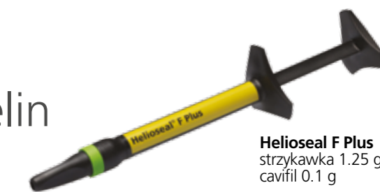
Helioseal F Plus strykawka 1.25 g cavifil 0.1 g