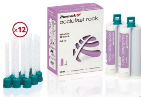
Occlufast 2 x 50 ml + 12 końcówek mieszających

Silikonowa masa wyciskowa typu A do rejestracji stosunków przestrzennych między żuchwą a szczęką. Twardość 95 Shore'A.