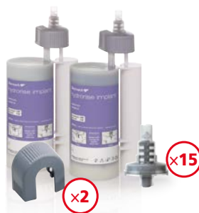
Hydrorise Implant Heavy Body 2 x 380 ml