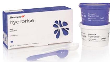
Hydrorise Putty 2 x 300 ml