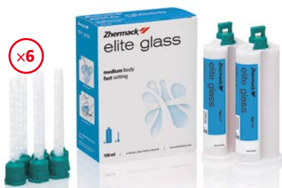
Elite Glass 2 x 50 ml + 6 końcówek mieszających

Przezroczysty silikon typu A do polimeryzacji materiałów światłoutwardzalnych. Twardość 70 Shore'a A