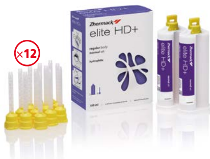
Elite HD+ Light/Regular 2 x 50 ml