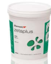
Zetaplus L / VL Intro Kit Zetaplus / Zetaplus Soft +Oranwash + Indurent Gel