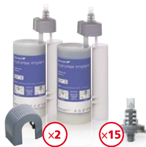
Hydrorise Implant Medium Body 2 x 380 ml

Silikon typu A o dużej twardości i zapachu mięty przeznaczony do implantoprotetyki.