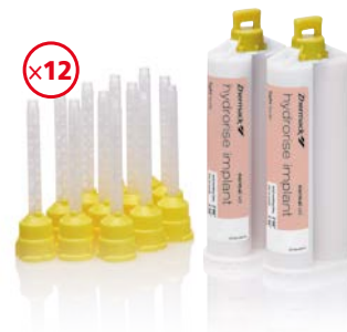
Hydrorise Implant Light Body 2 x 50 ml

ZAPYTAJ PRZEDSTAWICIELA O SPECJALNĄ OFERTĘ NA MASY POD WYCISKI IMPLANTOLOGICZNE!