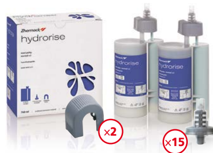
- Hydrorise Maxi Putty 2 x 380 ml - 499,90 zł - Hydrorise Maxi Heavy 2 x 380 ml - 549,90 zł - Hydrorise Maxi Monophase 2 x 380 ml - 549,90 zł