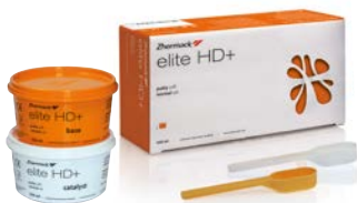
Elite HD+ Putty 2 x 250 ml