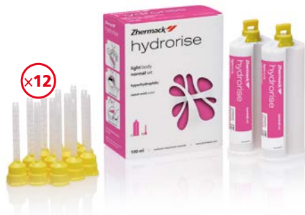
Hydrorise Light/Regular 2 x 50 ml